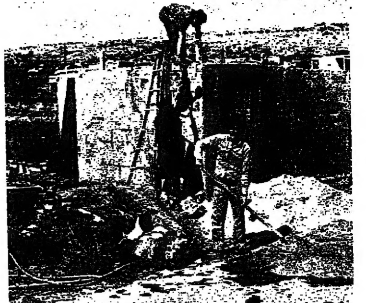
أعمال برسيم في حولا

منطقة الجنوب الحدودية - استعادت بعض نشاطها في وقت بدأت فيه القوى المسلحة بالاستعداد للانسحاب بعيدا لدخول الجيش. وقد اضعفت المظاهر المسلحة من بعض المناطق، وما بقي منها بدأ بالانحسار. هذا ما ساهم في جولة قضاة الى منطقة النطاق الاوسط حيث كانت موجة من المأزق مع الاعلى، حتى المسلحون انفسهم كانوا يمتنعون من قرب موعد الانسحاب.